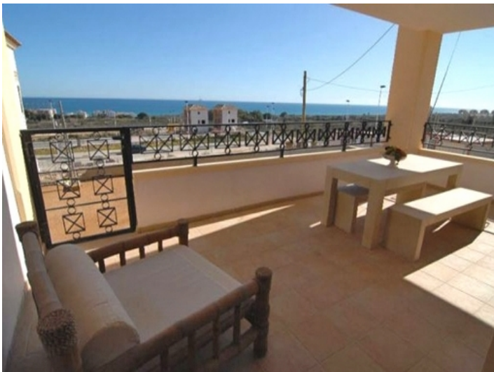
Great terrace view