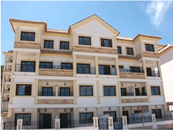
Front view of the apartment building