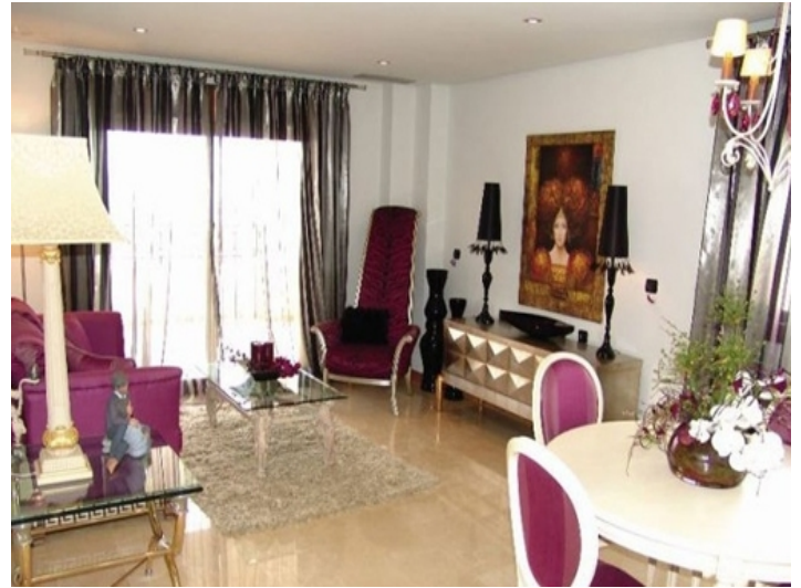
Spacious living room